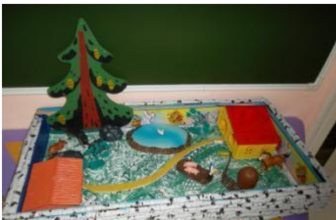
Макет "Хозяйский двор"

В своей деятельности использую макеты, изготовленные совместно с родителями